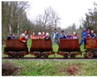
Abenteuer für die Kleinen am Zechengelände

Auf der Forststraße, die von Stockheim nach Traindorf führt, wenden wir uns nach links zur Infotafel „Schürfgräben“ und halten uns dann rechts. Auf der Anhöhe gehen wir die ganz rechte Forststraße, sie führt uns um den Hausberg der Stockheimer, den 405 Meter hohen „Spitzberg“. Von der Ostseite des Spitzberges können wir zwischen den Bäumen die Häuser von Neukenroth erkennen. Im Tal kommen wir zu einer Teerstraße, die von Neukenroth nach Traindorf führt. Ihr folgen wir nach links, hier befindet sich ein schöner Aussichtspunkt auf Neukenroth und die Bahnlinie München – Berlin. In der scharfen Kurve der Teerstraße laufen wir geradeaus in die Hohl-gasse. Oben angekommen, treffen wir wieder auf die Forststraße und folgen ihr. Am Bienenhaus gehen wir links zur Infotafel „Traindorf“ und folgen dem Weg wenige Meter weiter rechts zur Landesgrenze.