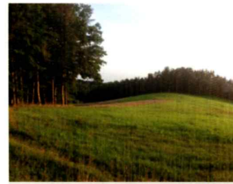
Blick über das Grüne Band oberhalb von Buch

An der Landesgrenze Bayern – Thüringen laufen wir links den Berg hoch, vorbei an einigen alten steinernen Zeugen der Landesgrenze. Nachdem der Weg wieder leichtes Gefälle hat, zweigt er nach rechts ab. Wir überqueren den „Minengürtel“ aus der DDR-Zeit und gelangen bei der Freifläche auf das Areal der Grube Minna. Nach der Schließung 1911 wurden die Grubengebäude zu einem Kindererholungsheim und später als Kaserne der DDR Grenztruppen umgebaut um dann 1981 endgültig abgerissen zu werden.